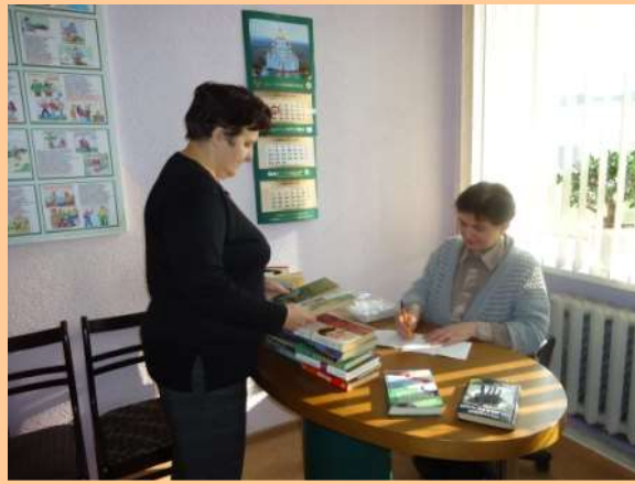
- ДП "Мастоўская сельгастэхніка"