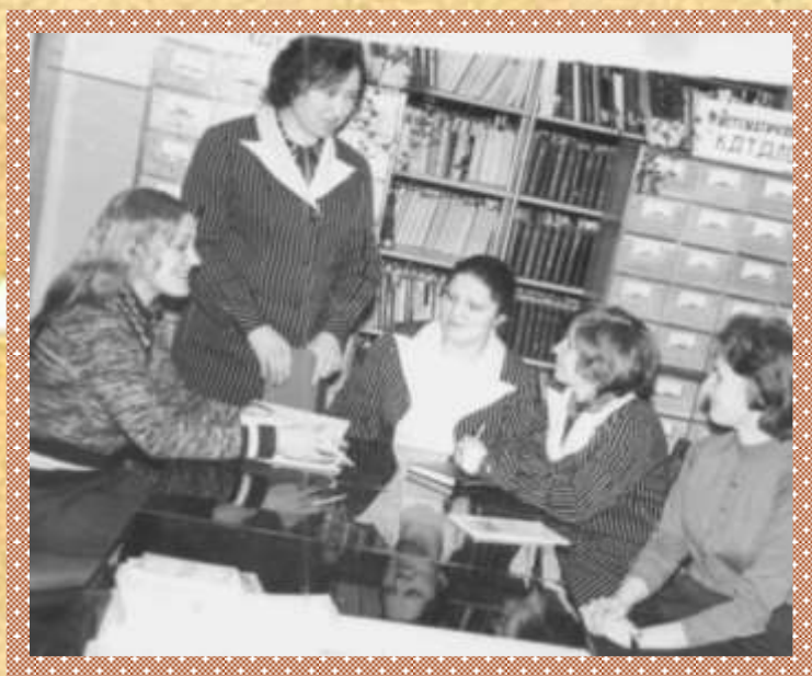
Нарада пры дырэктару