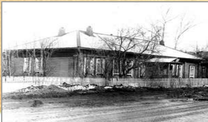
Бібліятэка на вул. Савецкай д. 31

У 60-ыя гады паспяхова працавалі перасоўкі ад раённай бібліятэкі ў калгасе імя Калініна, (в.Забалаць), калгасе імя Леніна (в.Вайнілавічы).